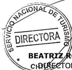
BEATRIZ ROMÁN ALZÉRRECA DIRECTORA NACIONAL (S) SERVICIO NACIONAL DE TURISMO